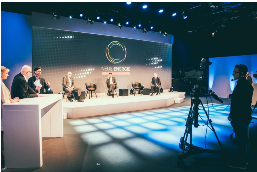
Bild 2: MVDA/LINDA Bildunterschrift: Die MVDA/LINDA Führungsriege auf der Bühne.